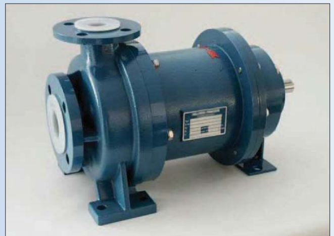
Die Geko NM – eine Chemie-Magnet-Normpumpe nach DIN EN 22858. Sie ist nahezu universell korrosionsbeständig. Die zu fördernden Flüssigkeiten kommen nur mit PTFE, PFA, Oxidkeramik, Zirkonoxid oder Siliziumkarbid in Berührung.

„Unsere besondere Stärke ist neben der Konzentration auf hochkorrosive Anwendungen, dass wir unsere Pumpen ab der Losgröße 1 mit kürzesten Lieferzeiten zur Verfügung stellen können. Wer bei uns anruft, erhält in der Regel sofort ein Angebot oder auch Hilfestellung. Wir reagieren extrem schnell und liefern beispielsweise Standardpumpen innerhalb von nur 2 bis 3 Tagen aus. Wir haben teilweise neue Pumpen schneller geliefert, als wenn Großkonzerne diese intern bevorraten und aus dem eigenen Pool abrufen müssen. Damit bieten wir den Vorteil, dass unsere Kunden kein Kapi-